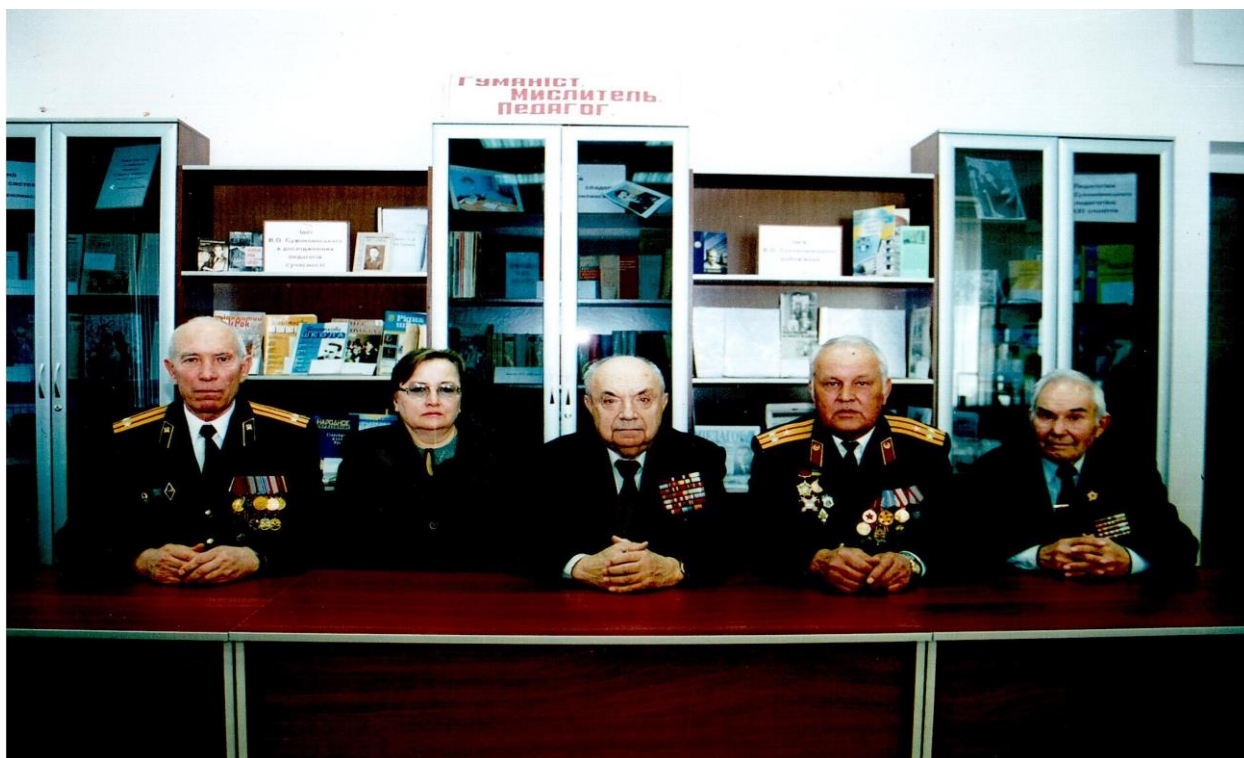
Засідання Ради ветеранів МНУ імені Ю.О. Грицая