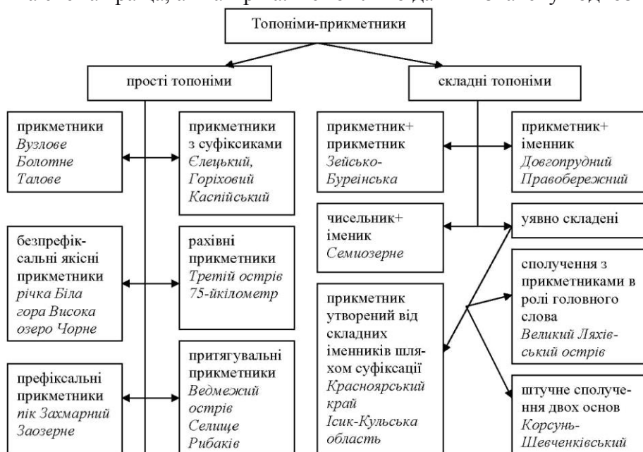
Рис. 3. Класифікація топонімів-прикметників

Висновок. Іще раз підтверджується думка про те, що неможливо створити універсальну єдину класифікацію такої складної, багатшарової, живої системи, якою є топонімія будь-якої країни або іншої великої територіальної одиниці. Яка схема краща, а яка гірша. Неможливо дати визначену і однозначну